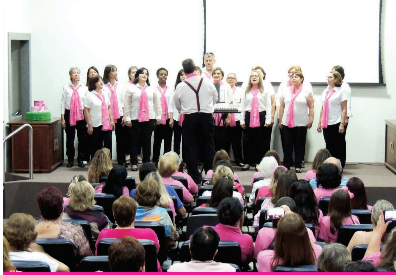
Além da palestra, os participantes do Outubro Rosa também assistiram à apresentação do belíssimo Coral da ALICC

Outro ponto abordado pela especialista, destacou a importância da mulher conhecer o seu próprio corpo para as-