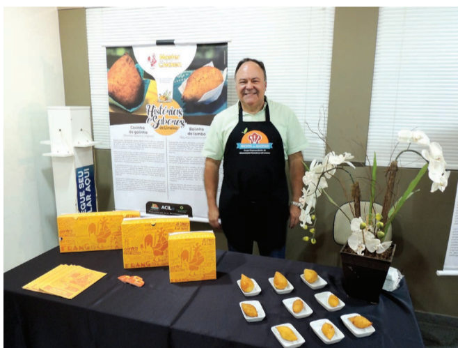
Aureo Tank Junior, Master Chicken